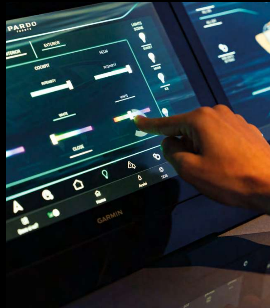
HIGH-TECH DASHBOARD WITH TRIPLE TOUCHSCREEN AND JOYSTICK / DASHBOARD TECNOLOGICO CON TRIPLO TOUCHSCREEN E JOYSTICK