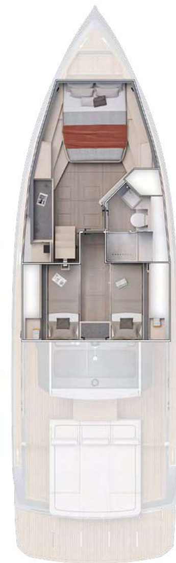
Optional Layout 1