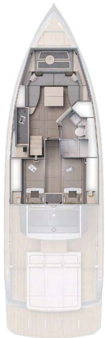
Optional Layout 2