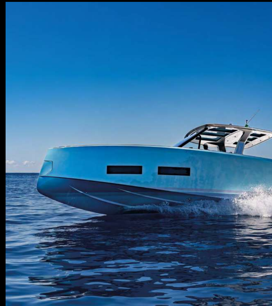
LARGE HULL WINDOWS FOR NATURAL LIGHT AND SEA VIEWS / AMPIE FINESTRE A SCAFO PER LUCE NATURALE E VISTA MARE