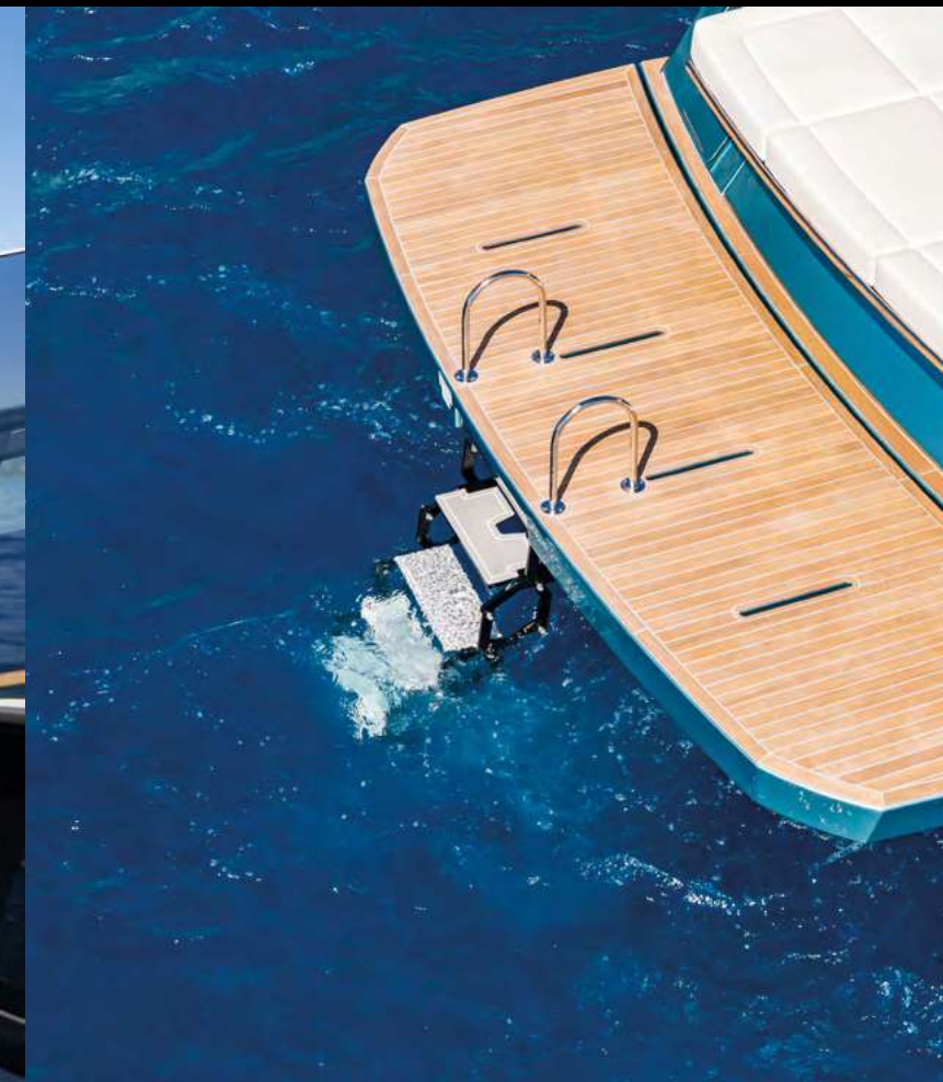
HYDRAULIC UP & DOWN SWIM PLATFORM WITH ELECTRIC BATHING LADDER / SPIAGGETTA IDRAULICA UP & DOWN CON SCALETTA BAGNO ELETTRICA