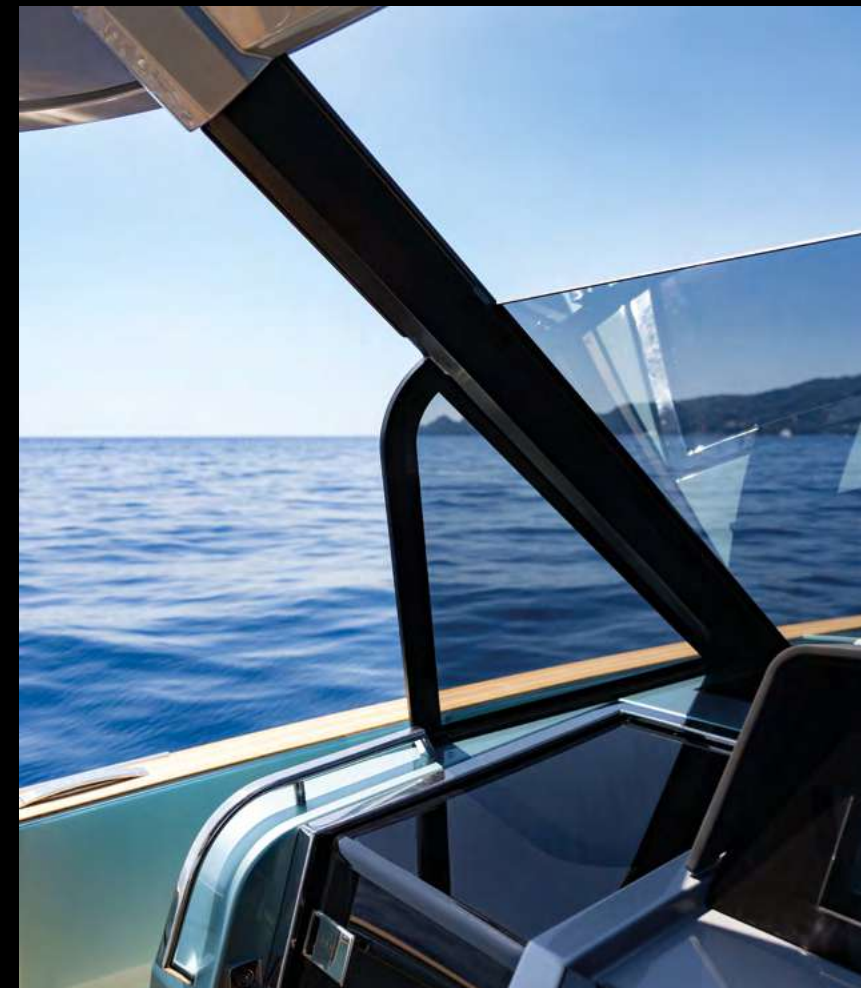
REDESIGNED CARBON T-TOP INTEGRATED WITH WINDSHIELD / T-TOP IN CARBONIO RIDISEGNATO E INTEGRATO AL PARABREZZA