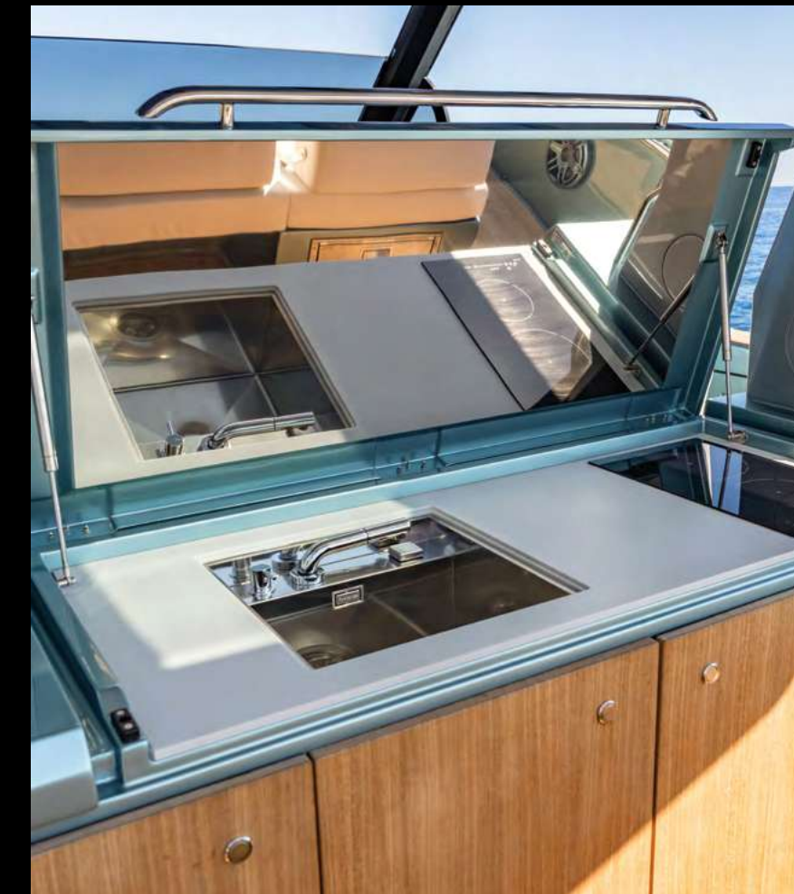
EXPANDED OUTDOOR GALLEY WITH INDUCTION HOB AND OPTIONAL BARBECUE / CUCINA ESTERNA AMPLIATA CON PIASTRA A INDUZIONE, POSSIBILITÀ DI AGGIUNTA BARBECUE