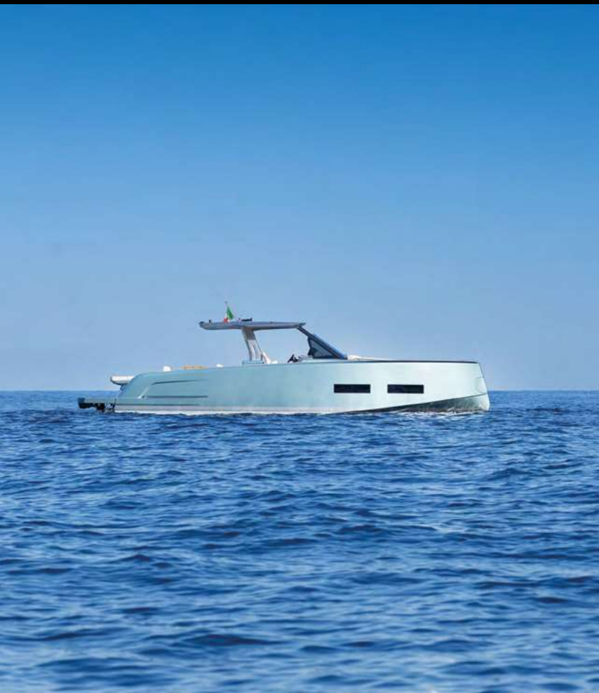
FLOWING SHEERLINE / SHEERLINE DISCENDENTE