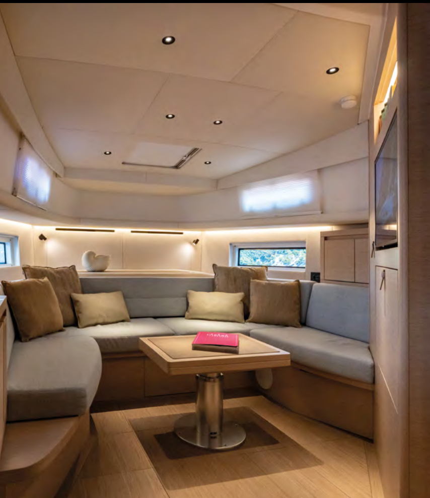
MODULAR INTERIORS: DINETTE WITH FIXED OR CONVERTIBLE BED / INTERNI MODULARI: DINETTE CON LETTO FISSO O TRASFORMABILE