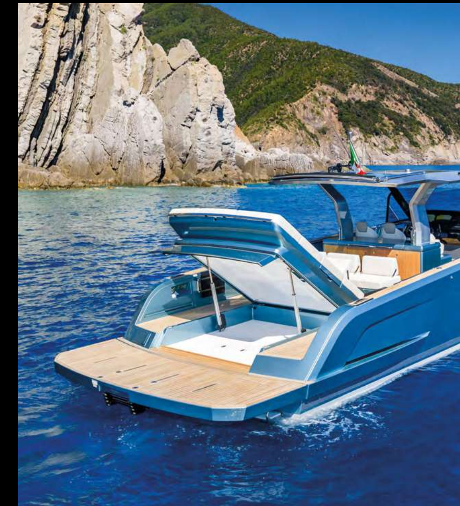
SPACIOUS TENDER GARAGE ALIGNED WITH SWIM PLATFORM / TENDER GARAGE AMPIO E ALLINEATO ALLA PLANCETTA