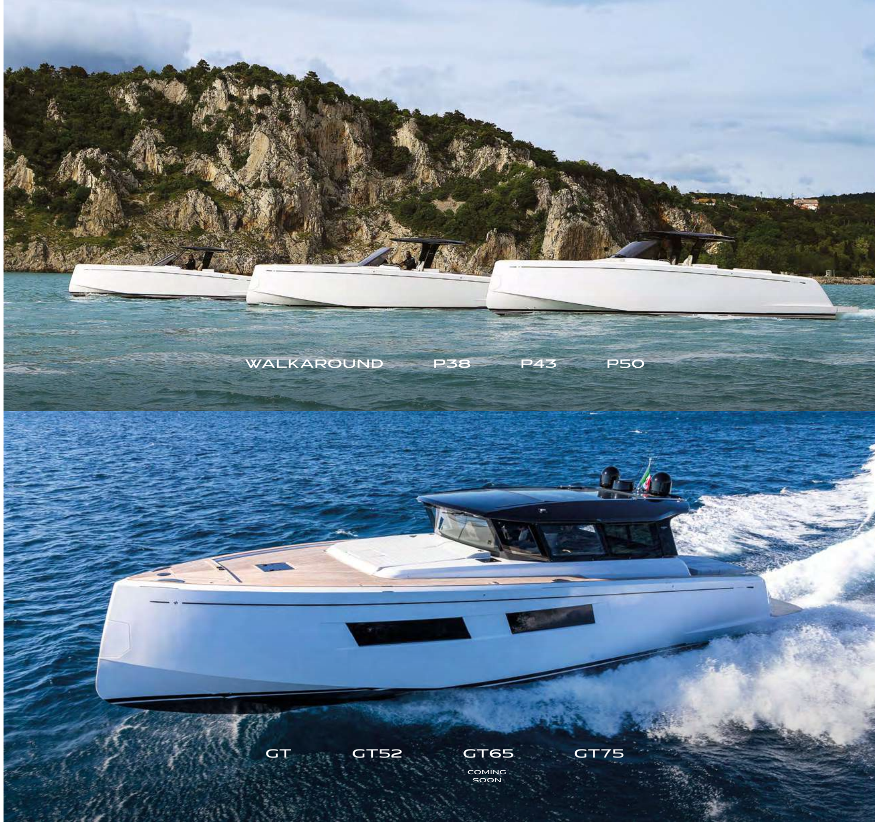
WALKAROUND P38 P43 P50

Una gamma che si va a posizionare tra la gamma Walkaround e quella Endurance rivolgendosi a un segmento di armatori alla ricerca di volumi ancora più vivibili e confortevoli rispetto agli attuali modelli walkaround, ma senza rinunciare alle performance.