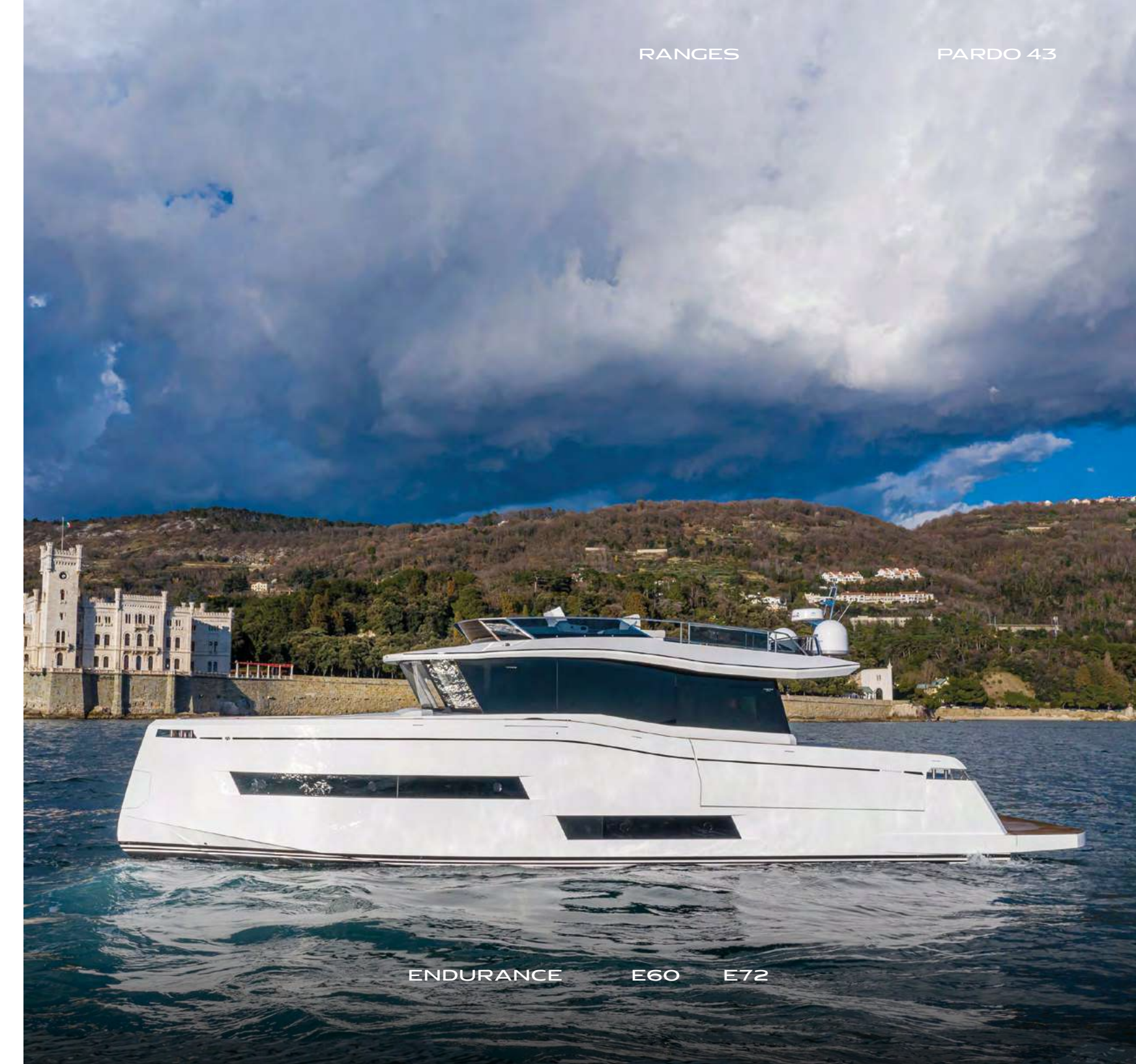
ENDURANCE E60 E72

La gamma Endurance è pensata per le lunghe tratte, grazie agli ampi spazi, ad una timoneria high-tech all'avanguardia e alla navigazione silenziosa. Il design presta particolare attenzione alle linee eleganti, alle forme regolari dello scafo e alla vivibilità interna, favorendo il comfort di bordo.