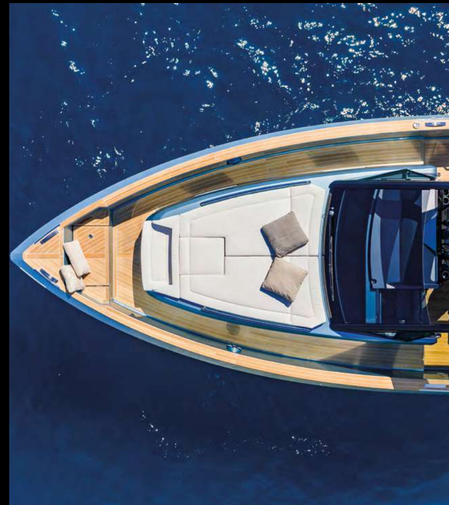
NEW BOW LOUNGE WITH FORWARD- FACING BENCH / NUOVA LOUNGE A PRUA CON PANCA FRONTE MARE