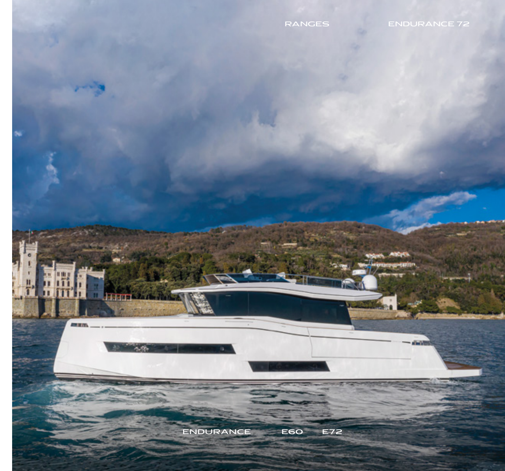
ENDURANCE E60 E72

La gamma Endurance è pensata per le lunghe tratte, grazie agli ampi spazi, ad una timoneria high-tech all'avanguardia e alla navigazione silenziosa. Il design presta particolare attenzione alle linee eleganti, alle forme regolari dello scafo e alla vivibilità interna, favorendo il comfort di bordo.