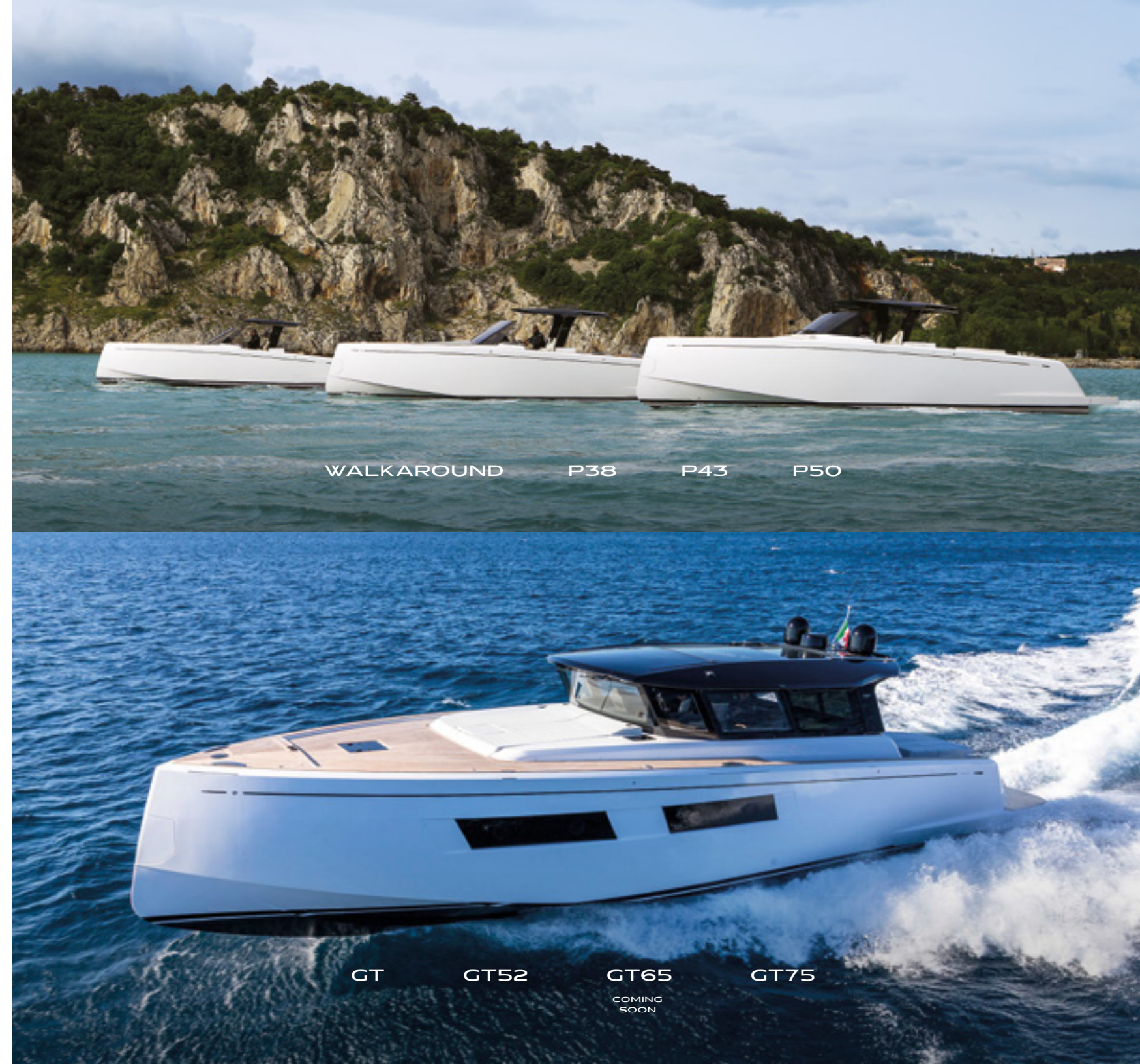
WALKAROUND P38 P43 P50

La gamma walkaround di Pardo Yachts è sinonimo di performance, fruibilità e comfort. Barche facilmente gestibili, progettate per navigare in sicurezza. L'ideale per chi predilige funzionalità e un design iconico.